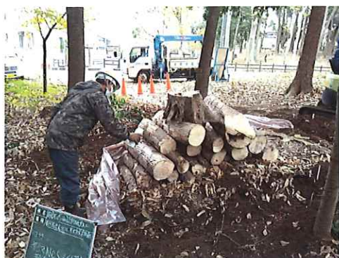
ナラ枯れ薬剤燻蒸施工中