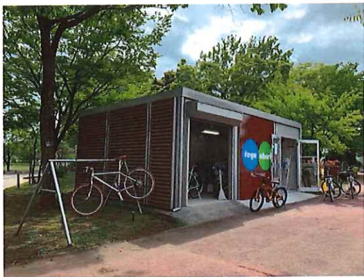
テガチャリ（自転車貸出受付）